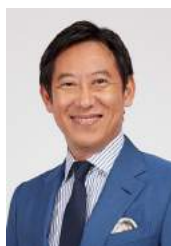
スポーツ庁長官 鈴木大地

結びに、本原則の策定に当たりご尽力されました公益財団法人日本ユニセフ協会をはじめ、関係者の皆様に深く敬意を表しますとともに、本原則の普及と浸透を祈念して、私からのご挨拶とさせていただきます。